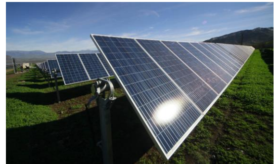
Planta fotovoltaica Quilapilún, ubicada en la Región Metropolitana.

Hoy genera el 7% de la electricidad del país y representa el 44% de la producción de energías limpias. En esta área Chile tiene el potencial más alto del mundo, debido a que el desierto de Atacama tiene los sectores con más alta radiación del planeta.